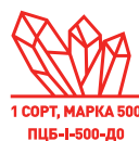
1 СОРТ, МАРКА 500 ПЦБ-I-500-ДО

Произведено из портландцемента высшего качества