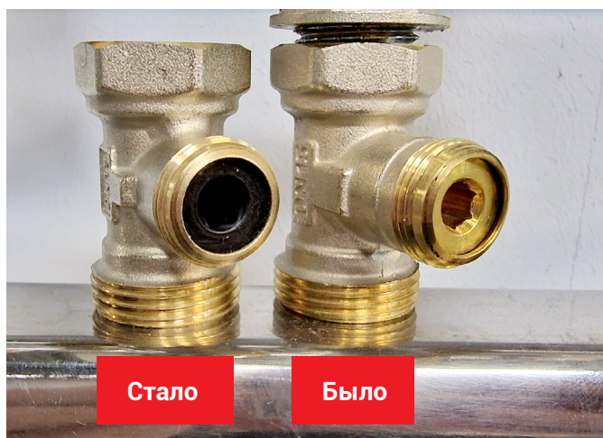
Сравнение старой и новой модификаций.

Просим учесть в вашей дальнейшей работе.